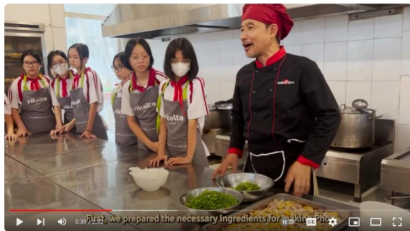
Cooking Chicken Pho - Uitwisseling tussen Vietnamese en Belgische leerlingen

Los estudiantes vietnamitas muestran el vídeo que realizaron sobre todo el proceso :